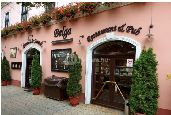
Belga Étterem 4025 Debrecen, Piac u. 29.