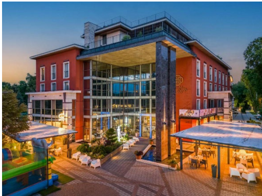
Hotel Divinus***** 4032 Debrecen, Nagyerdei krt. 1.