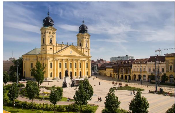
Debrecen Nagytemplom 4026 Debrecen, Piac u. 4-6.