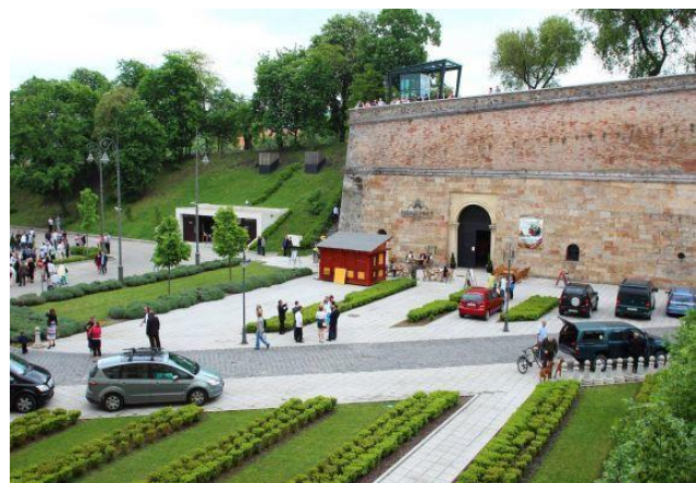
Prímás Pince – Étterem és Borlagút 2500 Esztergom, Szent István tér 12.