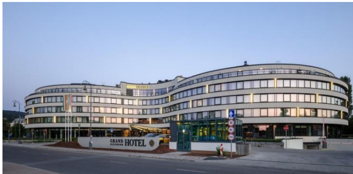
Grand Hotel Esztergom***** 2500 Esztergom, Tánics Mihály utca 6.